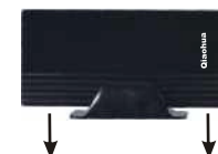
Питание от цифрового ТВ-ресивера